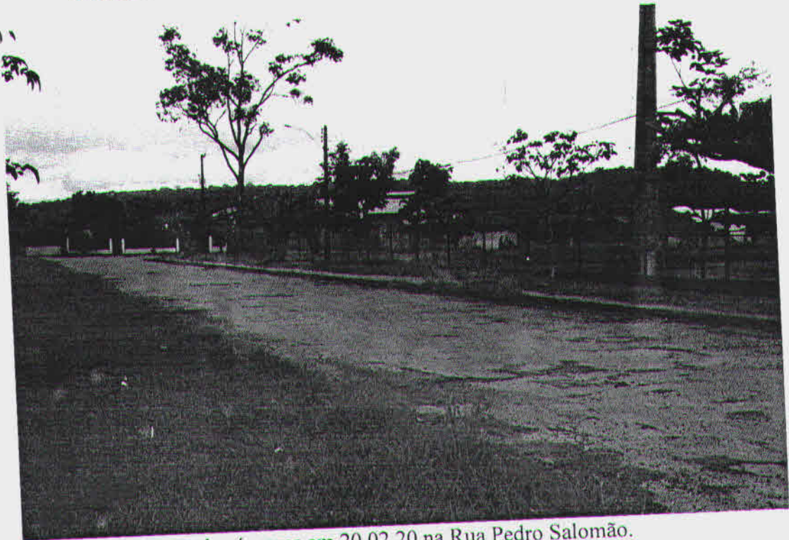
Figura 1. Situação das árvores em 20.02.20 na Rua Pedro Salomão.