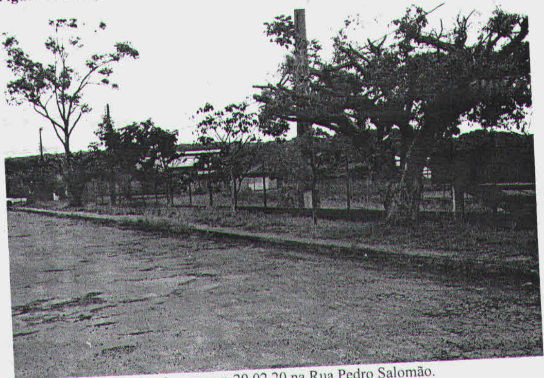
Figura 2. Situação das árvores em 20.02.20 na Rua Pedro Salomão.